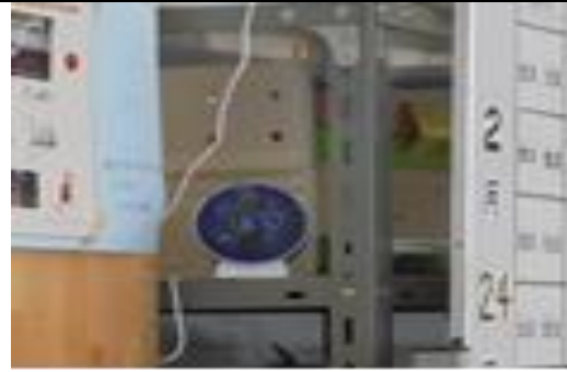
CO2濃度センサー訓練室にて使用