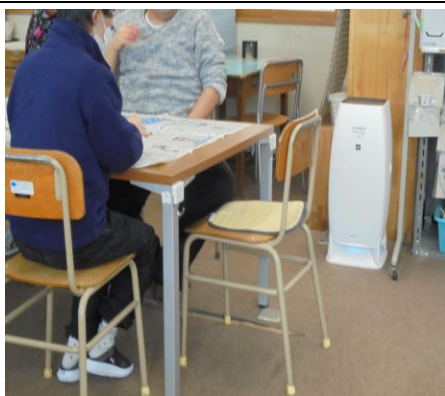
空間除菌消臭装置 訓練室にて使用