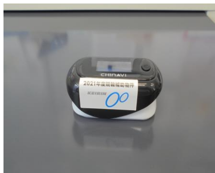
パルスオキシメーター