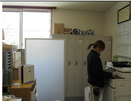
空間除菌消臭装置 事務所にて使用